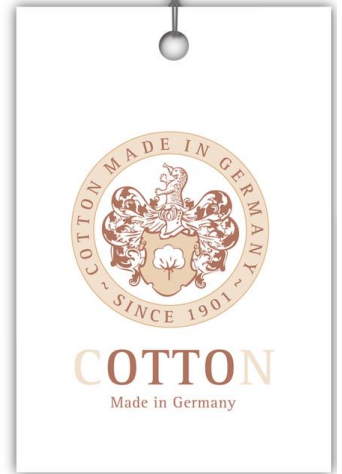
Cotton since 1901® Qualitätssiegel