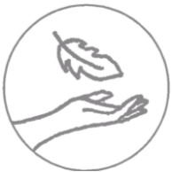
Sanft zur Haut