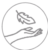
Sanft zur Haut