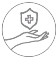
Schutz der Haut